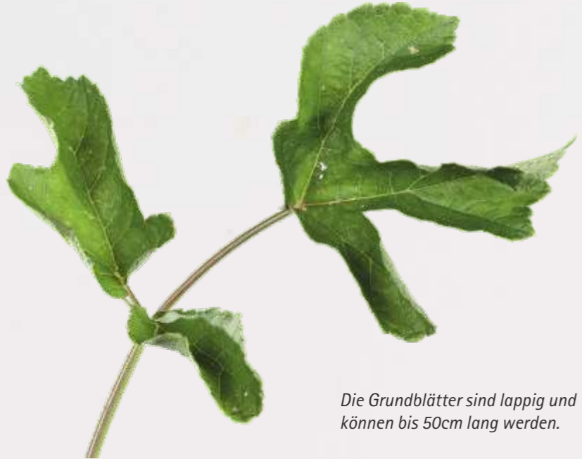
Die Grundblätter sind lappig und können bis 50cm lang werden.