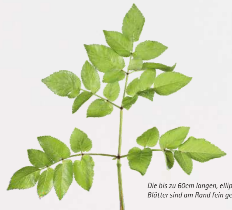
Die bis zu 60cm langen, elliptischen Blätter sind am Rand fein gezähnt.

Die Früchte mit ovalen, dünn gerippten Samen sind unbehaart.