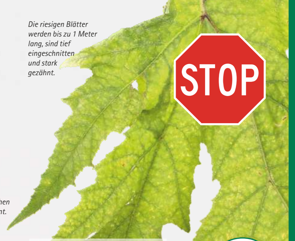
Die riesigen Blätter werden bis zu 1 Meter lang, sind tief eingeschnitten und stark gezähnt.

Die abgeflachten Früchte bilden ovale Samen mit fünf Rippen aus.