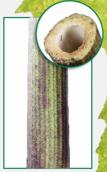
Der hohle Stängel ist im unteren Bereich oft rötlich gefleckt.

Der Saft dieser Pflanze führt unter UV-Einstrahlung zu überaus schmerzhaften Verbrennungen!